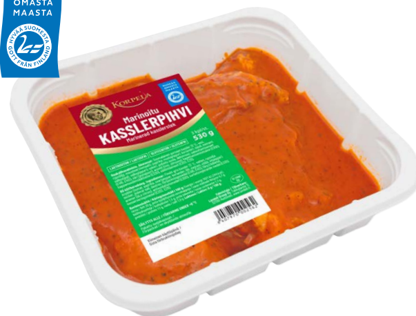
256 Marinoitu kasslerpihvi 3 kpl, 530 g