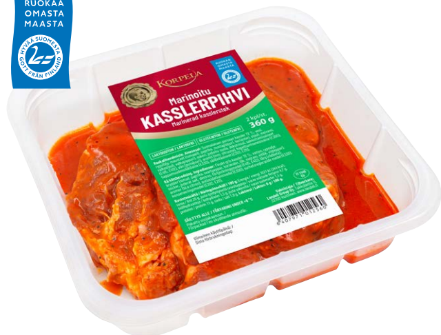
1256 Marinoitu kasslerpihvi 2 kpl, 360 g