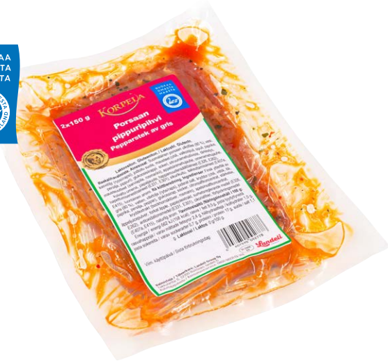
9277 Porsaan pippuripihvi, 300 g