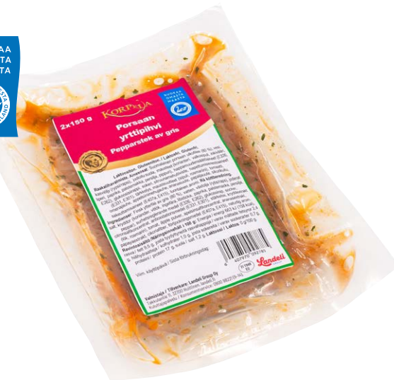
9278 Porsaan yrttipihvi, 300 g