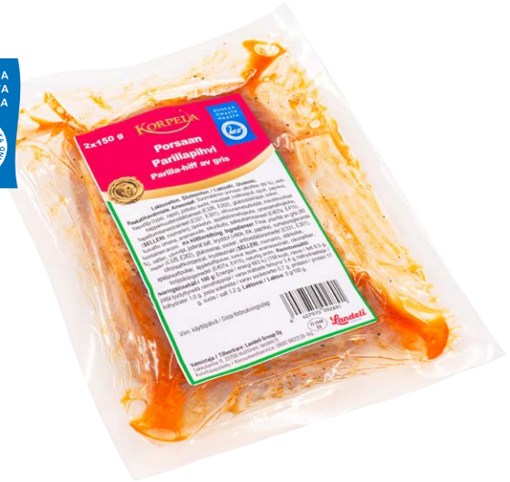
9289 Porsaan parillapihvi, 300 g