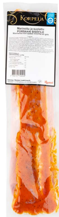
1042 Porsaan sisäfilee marinoitu, n. 600 g