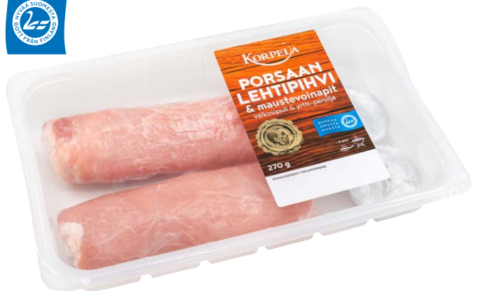
2478 Porsaan lehtipihvi, 270 g & maustevoinatit