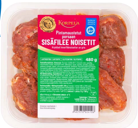
2410 Porsaan sisäfilee noisetit, pintamaustettu, 480 g